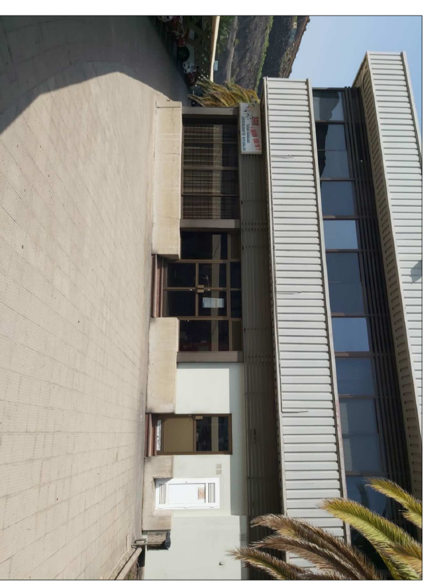
Imagen de la terraza de la cafetería