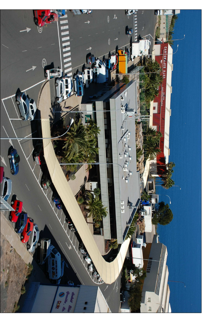
Imagen del Edificio Administrativo